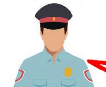
«ЛЖЕПРЕДСТАВИТЕЛЬ ПРАВООХРАНИТЕЛЬНЫХ ОРГАНОВ»

«Ваши данные попали в третьи руки и на Вас пытаются оформить кредит» «С Вашей карты пытаются перевести деньги» «Ваша карта (счёт) заблокированы» «Вам звонит «сотрудник Госуслуг» для установки самозапрета на кредиты»