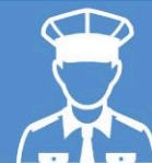
«ЛЖЕПРЕДСТАВИТЕЛЬ ПРАВООХРАНИТЕЛЬНЫХ ОРГАНОВ»