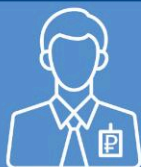
«ЛЖЕСОТРУДНИК БАНКА» (БАНК РОССИИ, ЦЕНТРОБАНК)