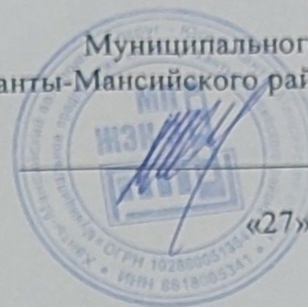
График проведения планового отлова животных без владельцев на территории Ханты-Мансийского района на декабрь 2024 года: