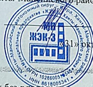
График проведения планового отлова животных без владельцев на территории Ханты-Мансийского района на ноябрь 2024 года: