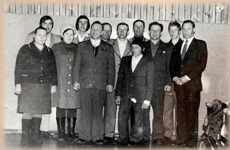
Участники семинара работников киносети Ханты-Мансийского района 1980-е годы.

60 лет назад (1963) в соответствии с Постановлением Совета Министров РСФСР №1151 от 24.09.63г. «О системе органов управления районной и городской киносетью» и решением исполкома Самаровского районного Совета депутатов трудящихся №203 от 17.12.63г. В Самаровском районе создана Самаровская районная дирекция киносети.